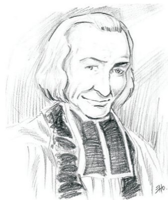
Santo Cura d' Ars Padroeiro dos Padres e Sacerdotes

Todos os anos, durante o mês de agosto, os católicos de todo o mundo celebram o mês das vocações, onde refletimos sobre a vocação do padre (no 1º domingo), sobre o pai, sobre a vida religiosa, sobre a vocação do leigo e a vocação do catequista (na ordem, a cada domingo). O primeiro domingo é dedicado ao dia do padre em memória de São João Maria Vianey, o Santo Cura d' Ars, que celebramos no dia 04 de agosto. Neste ano em especial celebramos também os 150 anos